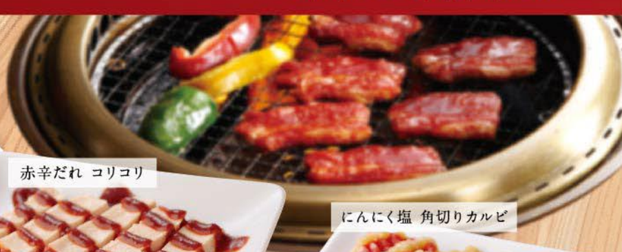
赤辛だれ コリコリ