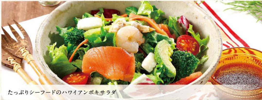
たっぷりシーフードのハワイアンボキサラダ

たっぷりシーフードのハワイアンボキサラダ 香草チキンのラタトゥイユサラダ チシャ菜(味噌付き)