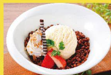
濃厚パナジェラートフルーツ添え