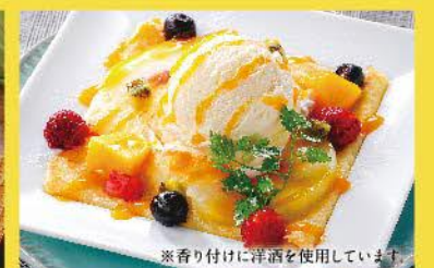
桃とマンゴーのチーズクレープガレット