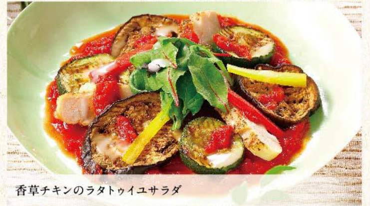
香草チキンのラタトゥイユサラダ

ブロッコリー…エクアドル / トレビス…アメリカ アボカド…ペルー / ズッキーニ…イタリア オレンジ…スペイン・アメリカ / なす…イタリア