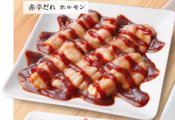
赤辛だれ ホルモン