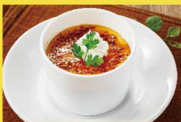
濃厚クリームブリュレ

コースをご注文のお客様はお一人様一品、当店自慢のデザートをご注文頂けます。 ※添えものは季節により変更する場合があります。