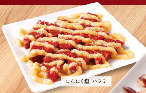
にんにく塩 ハラミ