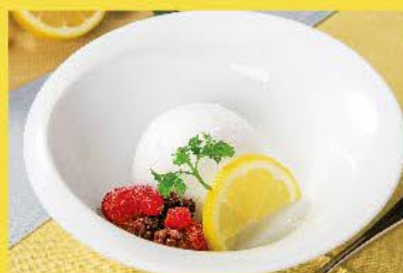
さっぱりレモンシャーベット